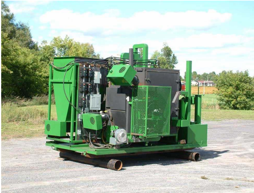
Mobil rask pyrolyse anlegg, [9]

Mens det er mange prosesser som er i ferd å være bygget eller demonstrert, virker det som det er ingen som har referanse anlegg for prosesser egnet til småskala produksjon. En prosess som er antageligvis klar for implementering er en mobil pyrolyse anlegg, [9]. Dette kan flyttes mellom biomasse kilder, og produsere en pyrolyse olje som er en mer kompakt form for energi, som kan transportere til videre omdanning eller bruk. Ulempen med pyrolyse olje er at det har lav pH, og høy vann og oksygen innhold som betyr at direkte brenning må foregå i spesielt kjel. Den prosessen kan anvendes i dag, mens det ventes på de spennende utviklinger som er i gang med prosesser som kan gir en mer anvendbar sluttprodukt.